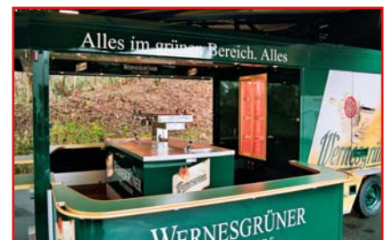
Gestaltungsmöglichkeiten der Kühlraumwand: Flaschenkühlregal

Die gesamte Dachkonstruktion ist beim Transport durch zentralverriegelte Klappen sauber verschlossen.