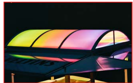
Sonderausstattung beleuchtetes Kuppeldach