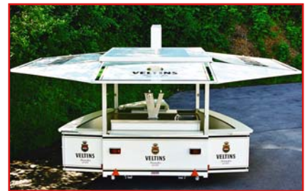
Trapezförmig ausklappbarer Verkaufsraum