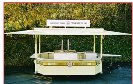
An der Vorderwand kann eine Flaschenkühltruhe gestellt werden