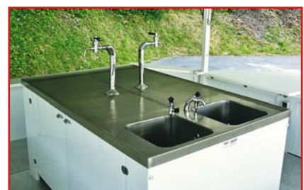
Stellplatz für 6 Fass à 50 l unter der Theke

Weitere Informationen sowie detailliertes Angebot auf Anfrage!