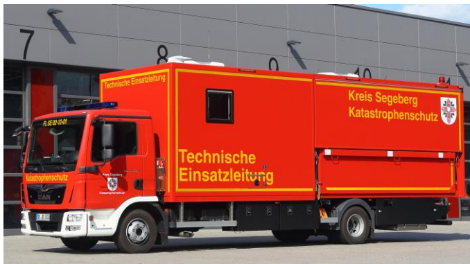
ELW2 SH V3 (ausklappbar) im Transportzustand