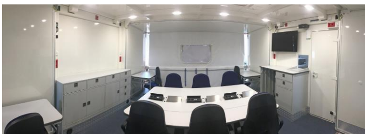
Besprechungsraum beidseitig ausgeklappt für 10 Arbeitsplätze