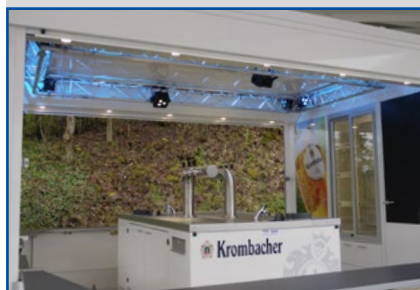
Traversenkonstruktion mit LED-Beleuchtung