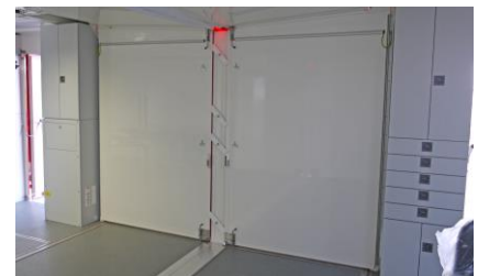
Innenansicht der Anhänger-Kopplung