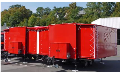
Anhänger-Kopplung: Dachverbindungsplane und Übergangslleiste