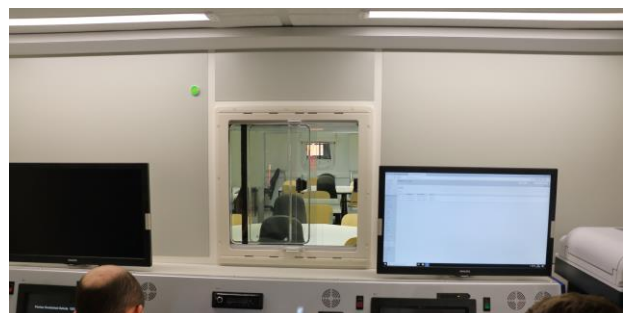
Blick vom Innenraum des FüKomKw in die AnhFüLa